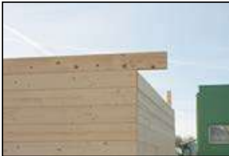
Aufbau nach technischen Daten