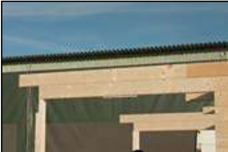
Vorder- und Hinterseite Anbau