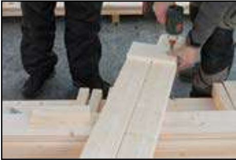
Verschrauben der Wandverlängerung