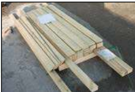
Kontrolle und sortieren anhand der Stückliste