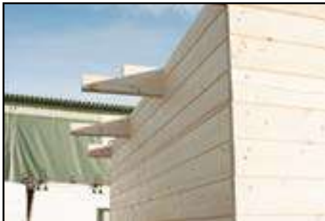
Dachsparren einlegen achten Sie auf technische Daten