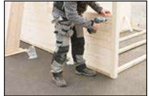
Montage weiterer Wandbohlen