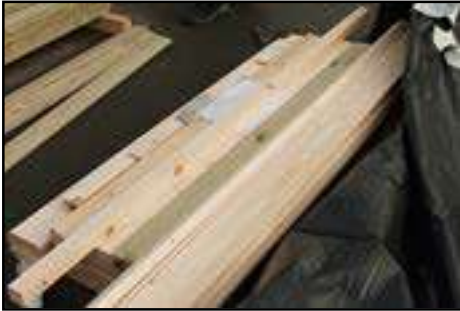
Öffnen von dem Paket Varianta Geschlossenewand