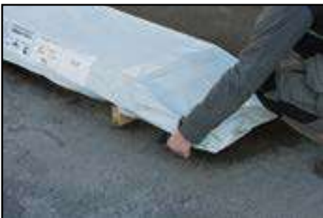
Öffnen von dem Paket Terrassenfußboden und Seitendach