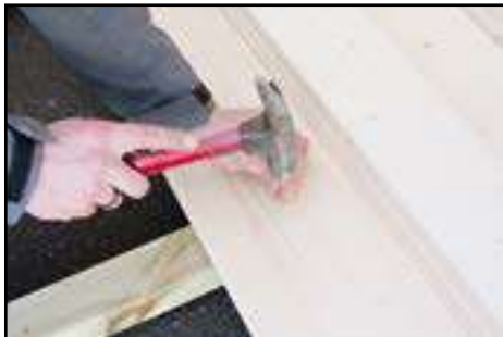
Fußboden im Haus einbringen und befestigen