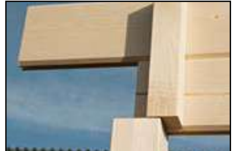
Position vom Stützpfosten Anbau