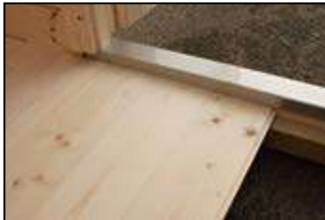
Fußboden im Haus einbringen, eventuell zuschneiden und befestigen