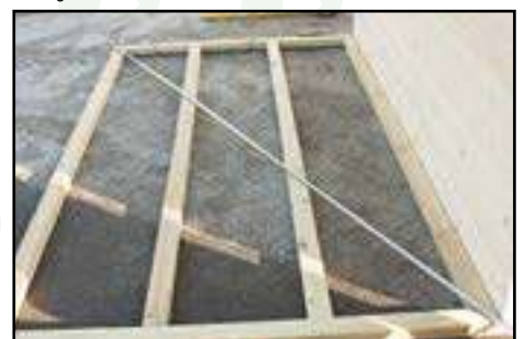
Diagonale vom Fundament kontrollieren