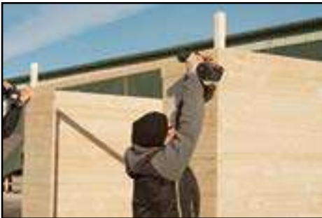
Anbringen der oberen Wandbohle (Tür)