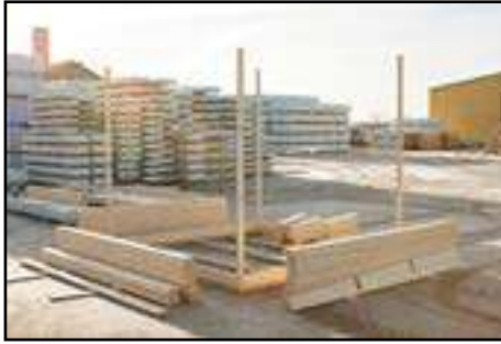
Vorbereiten der passenden Wandbohlen