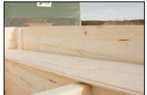
Auflegen der Dachbretter