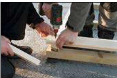
1. Wandbohle am Eckkantholz vorbohren und verschrauben