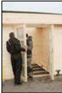
Einhängen der Türen und justieren