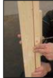
Anschauben der Führingleiste laut technische Daten