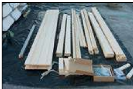
Vorbereitung und Kontrolle der einzelnen Bauteile