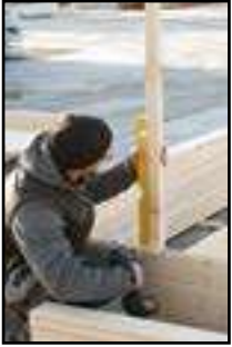
Kontrolle mit Wasserwaage ob im Lot