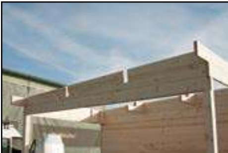
Seitenwand Montage Anbau