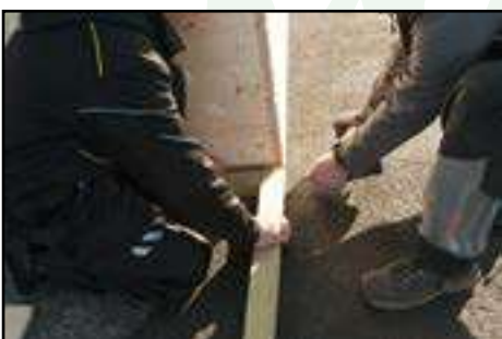
Verschrauben der Fundamenthölzer