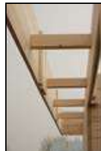
Ansicht der Giebelblende