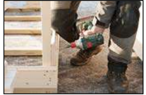
2. Bohlenkranz montieren