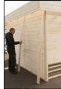
Abdeckleisten anbringen laut technischen Daten