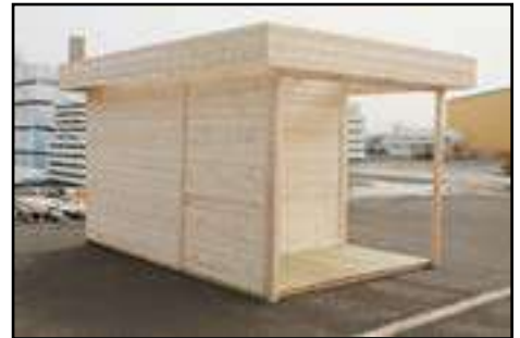
Fertige Rück- und Seitenansicht