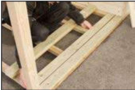
Verlegen und befestigen der Terrassenbretter