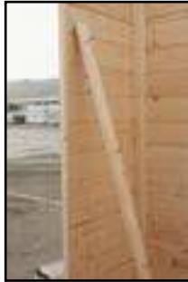
Bereitstellen der Türblendeleisten