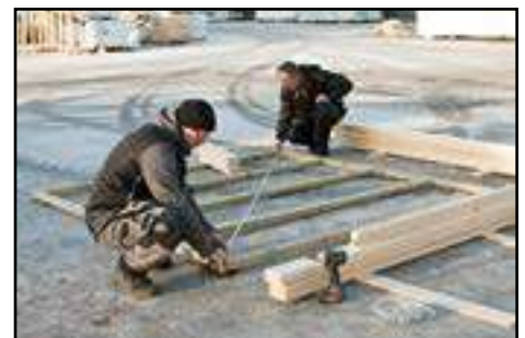
Diagonale vom Fundament kontrollieren