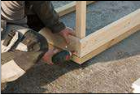
Verschrauben der Wandbohlen an den Eckkanthölzern