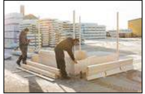
Anbringen der gesamten Wandbohlen