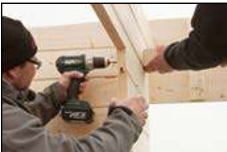
Verschrauben der Blende