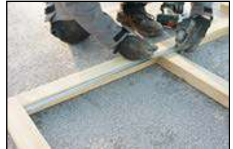
Genaue Abstände wie in technischen Daten einbringen