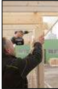
Anschauben der Führingleiste für Geschlossene Wand