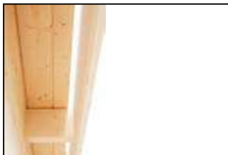
Abstände beachten laut technischen Daten