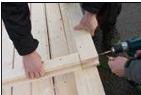
Verschrauben von dem Türrahmen