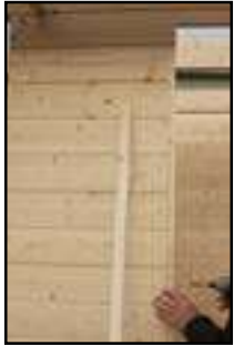
Türleisten anbringen laut technischen Daten