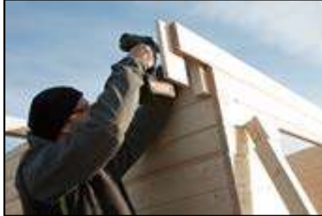
Montage der Wandverlängerung (vorne) nach technischen Daten