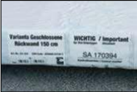
Paketaufkleber von den Paketen ausschneiden für Ihre Unterlagen