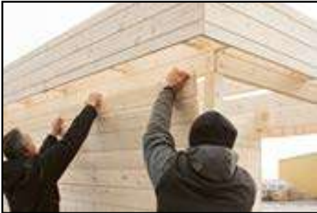
die letzten 4 Bohlen zusammen einsetzen und dann erst verschrauben