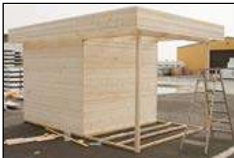
Fertige Ansicht vom Haus mit Anbau