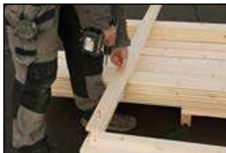
Verschrauben von dem Türrahmen