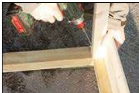
Eckkantholz am Fundament verschrauben