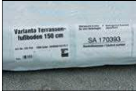
Paketaufkleber von den Paketen ausschneiden für Ihre Unterlagen