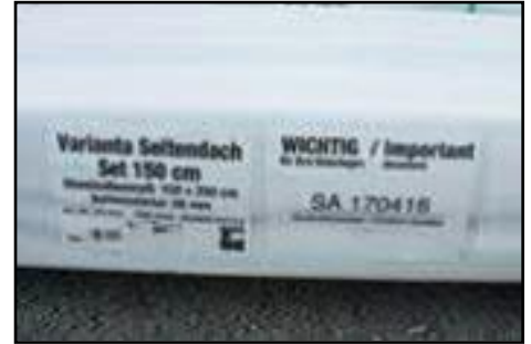
Paketaufkleber von den Paketen ausschneiden für Ihre Unterlagen