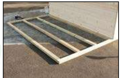
Auslegen von den Fundamenthölzern