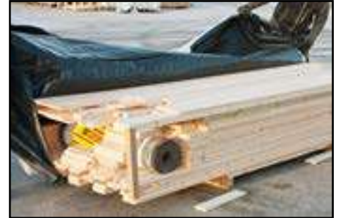
Kontrolle anhand der Stückliste