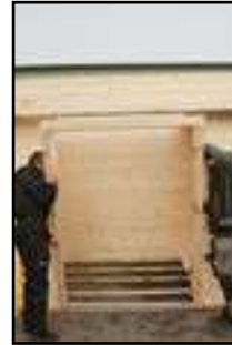
Einbau vom Türrahmen