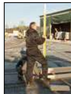
Eckkantholz in Waage ausrichten