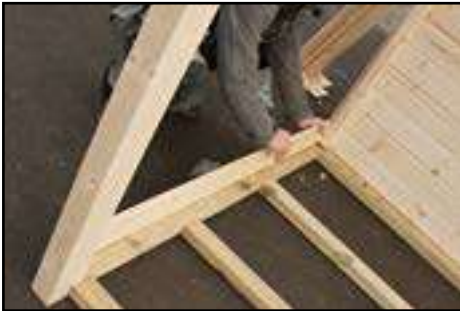
1. Wandbohle in Waage ausrichten