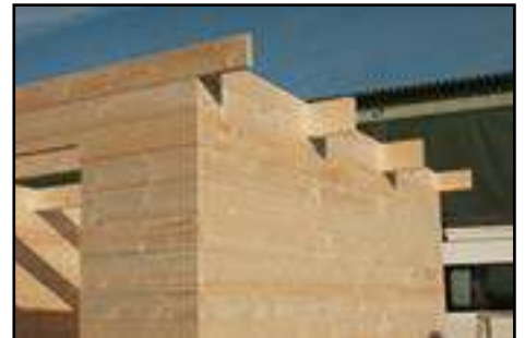
Auf die richtige Position der Sparren achten