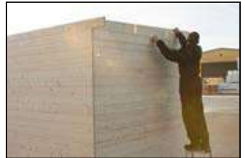
Letzte Bohlenreihe aufbringen