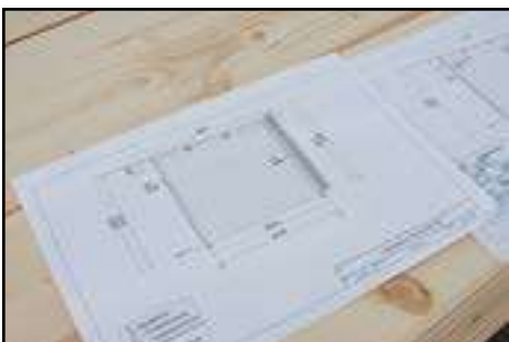
Der Aufbau Erfolgt genau nach den technischen Daten