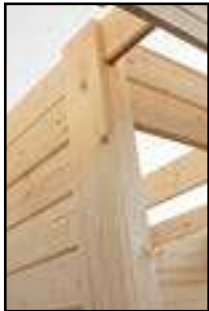
Abdeckleisten anbringen laut technischen Daten