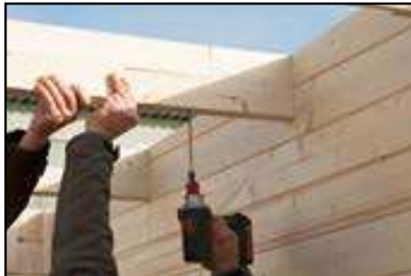
Auflegen und befestigen der Dachsparren