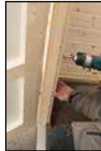
Befestigen vom Türrahmen mit den Türblendeleisten innen