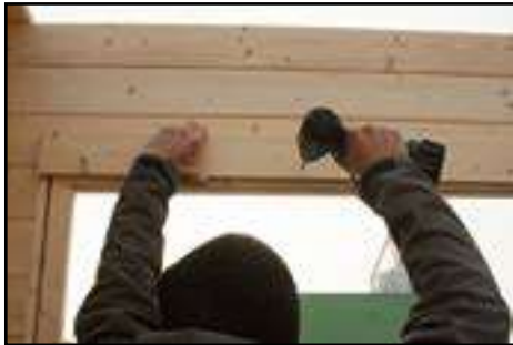
Befestigen vom Türrahmen mit den Türblendeleisten aussen