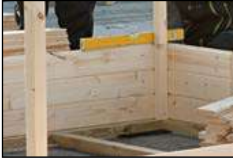
Kontrolle mit Wasserwaage ob in Waage