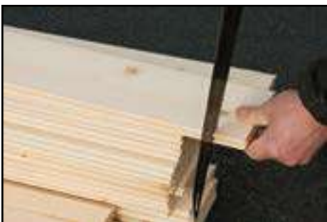
Dachbretter zuschneiden laut technischen Daten