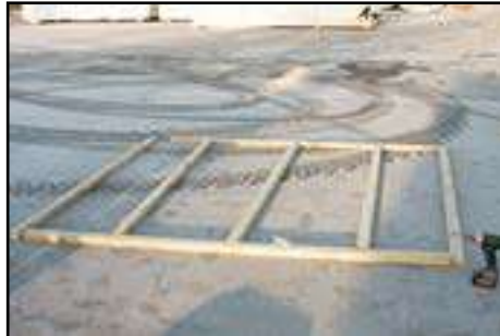
Fundamenthölzer auf gerades Fundament legen