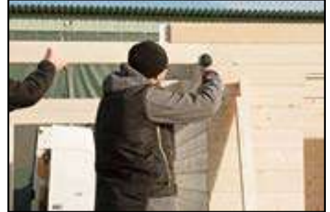
Montage der Wandverlängerung (vorne) nach technischen Daten