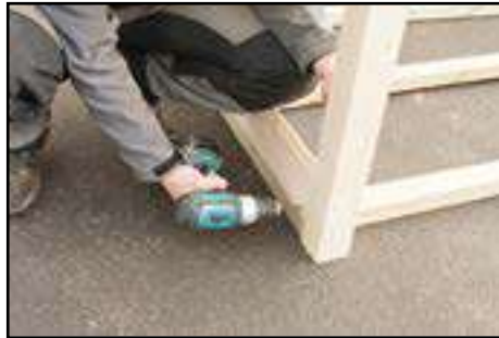
Verschrauben der 1. Wandbohle