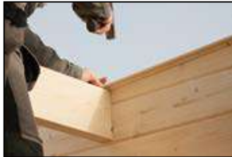
Anbringen der Dachbretter laut technischen Daten