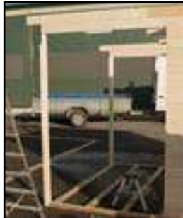
Vorder- und Hinterseite Anbau