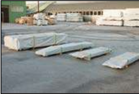
Anlieferung der Ware