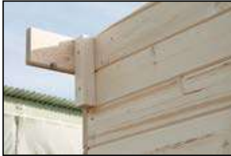
Montage der Wandverlängerung (hinten) nach technischen Daten