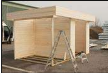
Ansicht Haus - Anbau - Geschlossenewand