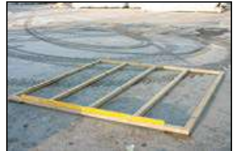
Kontrolle ob Fundamenthölzer in Waage