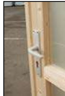
Anbringen der Drückergarnitur und Zylinderschloss