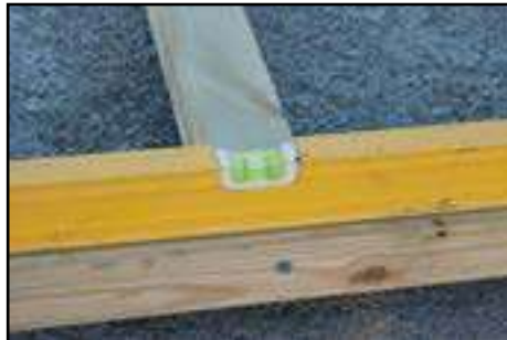
Kontrolle ob Fundamenthölzer in Waage