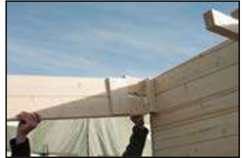
Montage der Wandverlängerung (hinten) nach technischen Daten