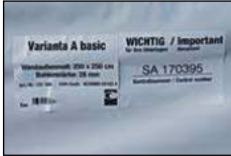
Paketaufkleber von den Paketen ausschneiden für Ihre Unterlagen