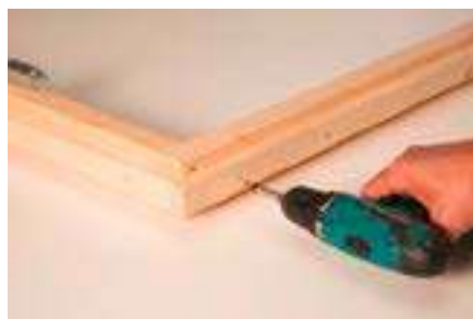
5. Leiste anschrauben