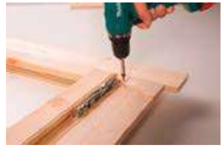
3. Anschrauben der Blenden