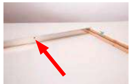
6. Das vorgebohrte Loch für den Feststeller muss nach außen zeigen