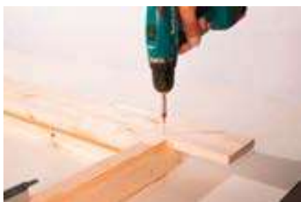
7. Anschrauben der Blende oben