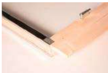
8. Seitenblende unterkante Türschwelle bündig