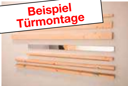
1. Türrahmen mit Leisten 3 x 28-70 mm und 6 Blenden