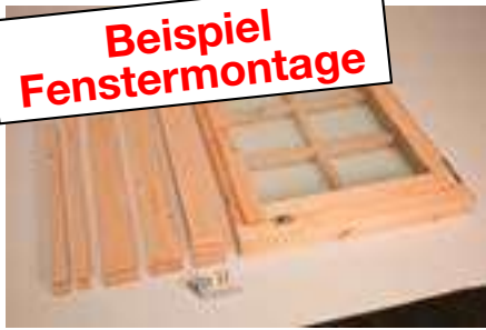
1. Einzelzimmer mit Leisten, 8 Blenden und 1 Fenstergriff