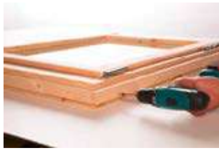
2. Anschrauben der Leisten