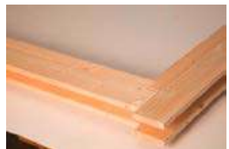
9. Ansicht fertig montierter Rahmen oben rechts